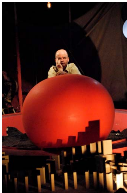
La compagnie s'appelle reviens 86 cm

Aller au spectacle pour la première fois est un moment important, un événement collectif, vécu en groupe, et un ressenti individuel des émotions en tant que spectateur. Le spectacle est avant tout un moment de plaisir partagé pour l'enfant et l'adulte qui l'accompagne, ensuite il peut y avoir une exploitation pédagogique possible dans la classe.