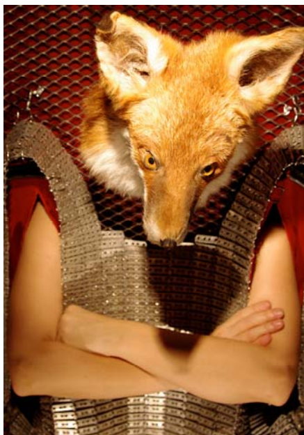
Compagnie hop !hop !hop ! La ligne d'or