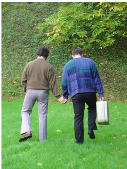
Bob théâtre, Hans et Greutel