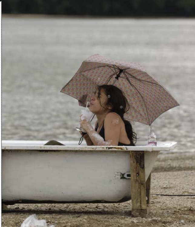
Compagnie Ostéorock, Baignade interdite