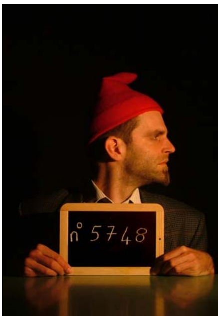
Compagnie Bakélite, Braquage et L'affaire Poucet